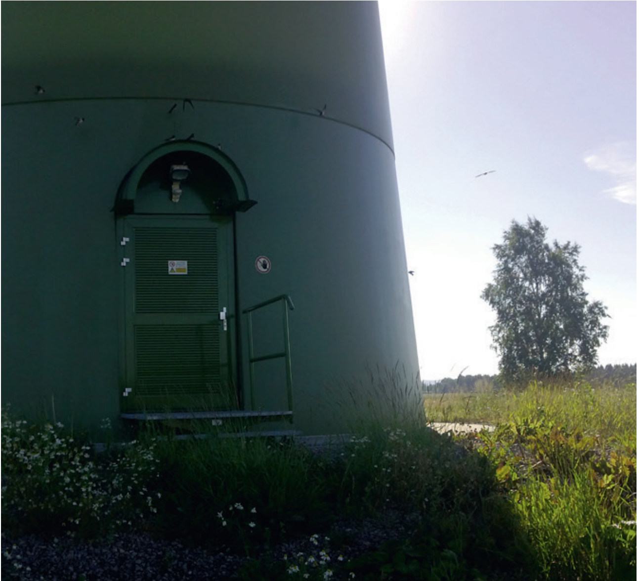
Exempel på att vindkraftverk inte slår ihjäl svalor. Ungarna lämnar boet som är på lampan ovanför dörren. Andra året i följd.”