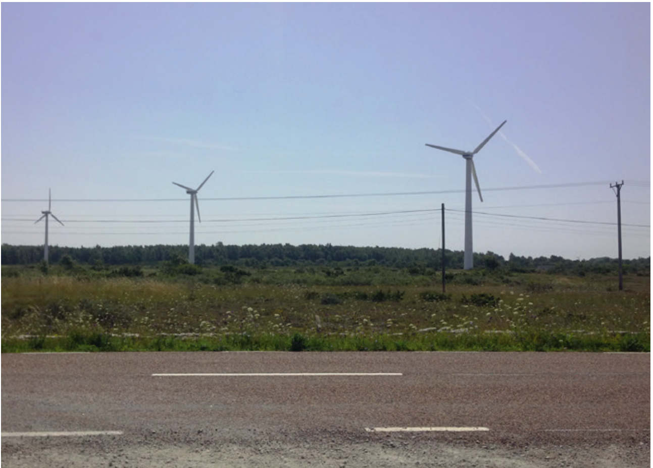
Vindkraftverk Grönhögen Södra Öland